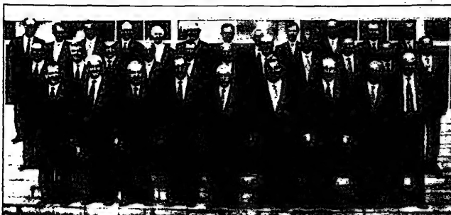
مجلس استاذية الحكومة العمري

لم تقبل المجلس الوطنية من مثل مجلس الجنوة، مجلس الاعمار و الامناء والهيئة العليا للاعانة وصندوق المرحومين من قبضة الجزوي التي حاول من خلالها تعذيب اجنته السياسية والاقتصادية بسبب لطيف المناسبي البستاني نجاح واكيم، وسيخضع واكيم في حلقة اليوم للظفر التي حملتها الجوزي، سيطرته على هذه المجالات وللجان، سواء كانت هذه جزءاً من محاكم لثة تصريف مشرع الاعمار الذي قام به الجوزي نفسه او جزءاً من تعويقها وتعويض الزوراء المسؤولة عنها، وقد تمت السيطرة على هذه المؤسسات من خلال صفقات وعمليات يسبقها واكيم بالمحاصصة.